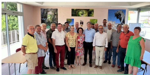
Café-débat sur le canton de Saint Porchaire