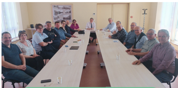
Café-débat sur le canton des 3 Monts, au Fouilloux, à Chartuzac et à Chepniers

Depuis avril, ce sont plus de 40 maires et 60 élus rencontrés. Ces réunions se poursuivront à l'automne. Un grand merci à tous les collègues pour leur accueil !