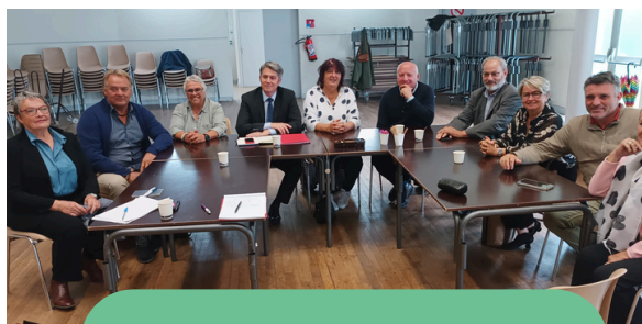
Café-débat sur le canton de la Tremblade, à Etaules