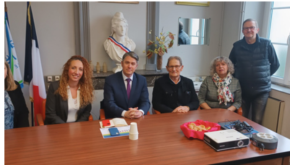
Mairie de Pisany – Rencontre du Maire et des élus autour des projets municipaux : nouvelle Mairie, restructuration de l'école, aménagement d'un parking... (Février)

Ces visites de terrain permettent de mieux appréhender leur quotidien mais aussi de saisir plus finement la nature de leurs activités, les contraintes auxquelles ils sont confrontés ainsi que leurs préoccupations.