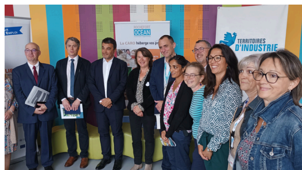
Service Public de l'Emploi – Rochefort : France Travail, Mission Locale, Cap Emploi, PLIE et service économique de la CdA Rochefort Océan. Point sur la Loi pour le Plein Emploi (Juin)