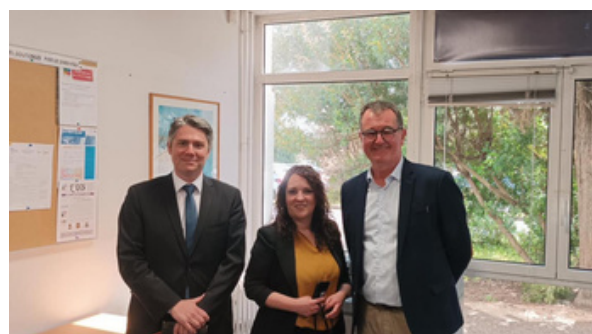
GRETA La Rochelle : Rencontre avec le équipes pédagogiques et les personnes en apprentissage du français : point sur les nouvelles exigences de niveau, le manque de places ...(Mars)