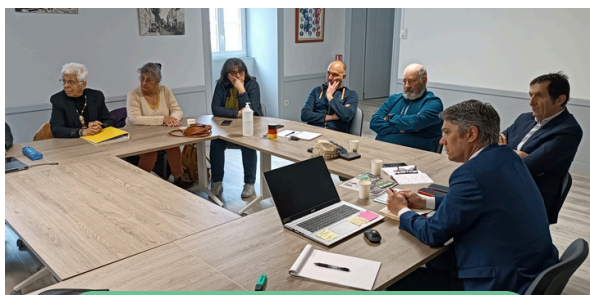
Café-débat avec les élus de la vallée du Coran, à la Chapelle des Pots