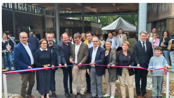
Inauguration de l'école de Bourgneuf (septembre)