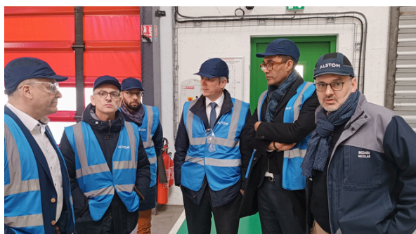
Visite de l'entreprise Alstom – Aytré avec les Maires d'Aytré, de Dompierre/Mer et de La Jarrie. (Mars)